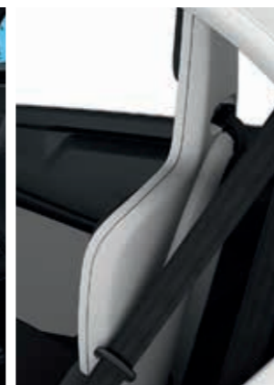
Sitzschale Weiß (optional)