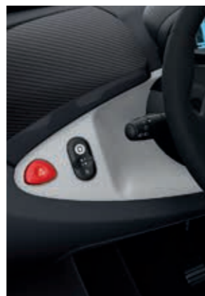
Armaturenbrett Weiß (optional)