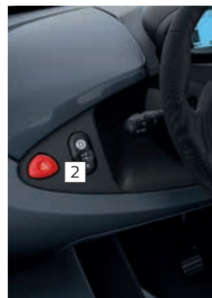
Armaturenbrett Schwarz (serienmäßig)