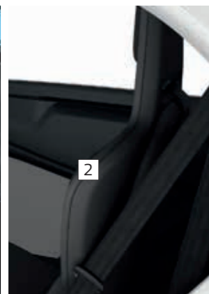
Sitzschale Schwarz (serienmäßig)